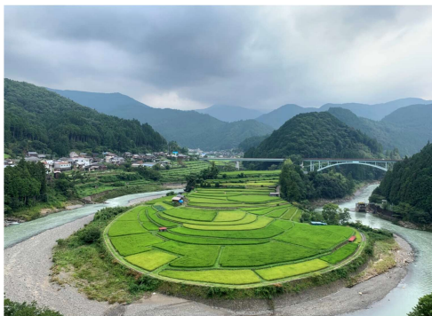
「あらぎ島」

承認 昭和28年3月2日 事務所 〒646-0031 田辺市湊23-6 TEL 0739-24-2002 FAX 0739-26-0264 mail tanabe-rc@helen.ocn.ne.jp