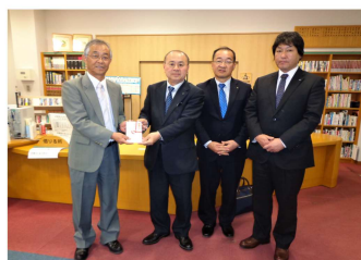
みなべ町立図書館