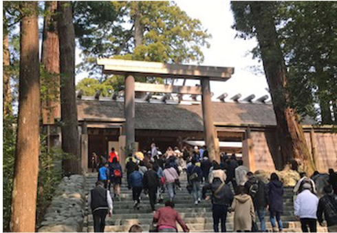
「伊勢神宮-内宮-」

承認 昭和28年3月2日 事務所 〒646-0031 田辺市湊23-6 TEL 0739-24-2002 FAX 0739-26-0264 mail tanabe-rc@helen.ocn.ne.jp