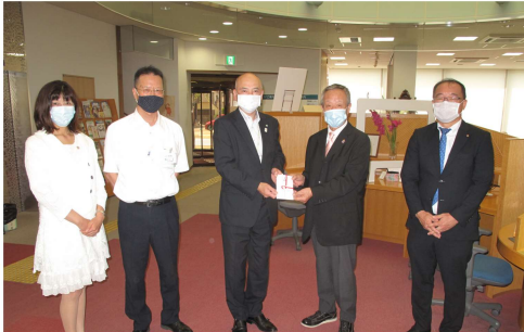
「ロータリー文庫寄贈-みなべ町立図書館」 -2020年6月5日-

承認 昭和28年3月2日 事務所 〒646-0031 田辺市湊23-6 TEL 0739-24-2002 FAX 0739-26-0264 mail tanabe-rc@helen.ocn.ne.jp