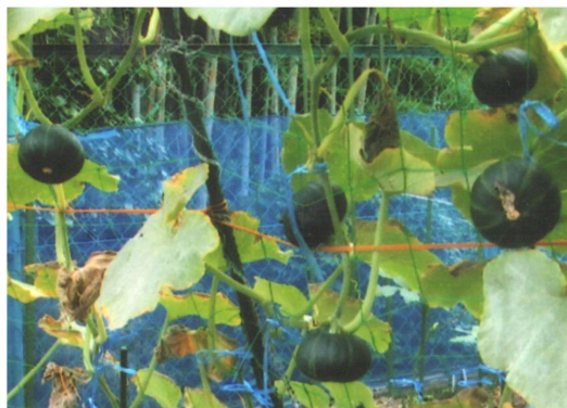
「南瓜豊作です！」

承認 昭和28年3月2日 事務所 〒646-0031 田辺市湊23-6 TEL 0739-24-2002 FAX 0739-26-0264 mail tanabe-rc@helen.ocn.ne.jp