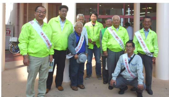
「麻薬・覚醒剤乱用防止運動街頭啓発」 -10月15日-オークワパビリオンシティ

承認 昭和28年3月2日 事務所 〒646-0031 田辺市湊1073-63 TEL 0739-24-2002 FAX 0739-26-0264 mail tanabe-rc@helen.ocn.ne.jp