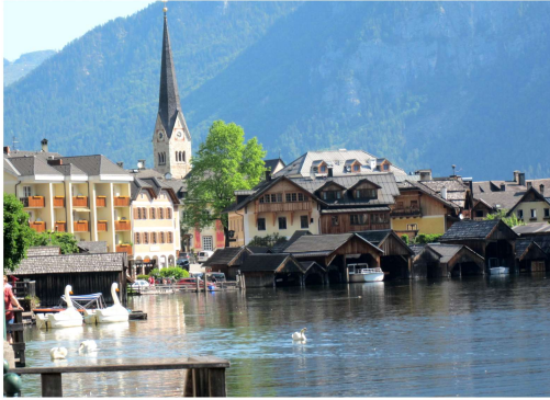
「ハルシュタット湖畔-オーストリア-」

承認 昭和28年3月2日 事務所 〒646-0031 田辺市湊23-6 TEL 0739-24-2002 FAX 0739-26-0264 mail tanabe-rc@helen.ocn.ne.jp