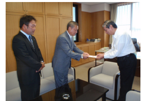
田辺市とみなべ町へ復興のための支援金をお渡ししました。