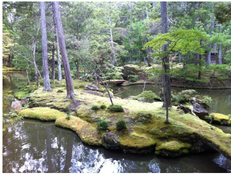
「苔寺 (西芳寺)」撮影 柏木壽夫会員

承認 昭和28年3月2日 事務所 〒646-0031 田辺市湊1073-63 TEL 0739-24-2002 FAX 0739-26-0264 mail tanabe-rc@helen.ocn.ne.jp